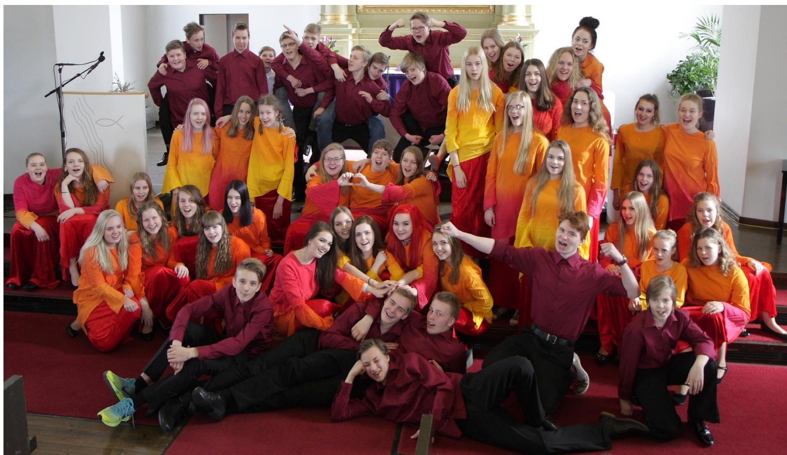
Vuoden 2022 musiikkiryhmä. Hämeenlinnan kuoropolku